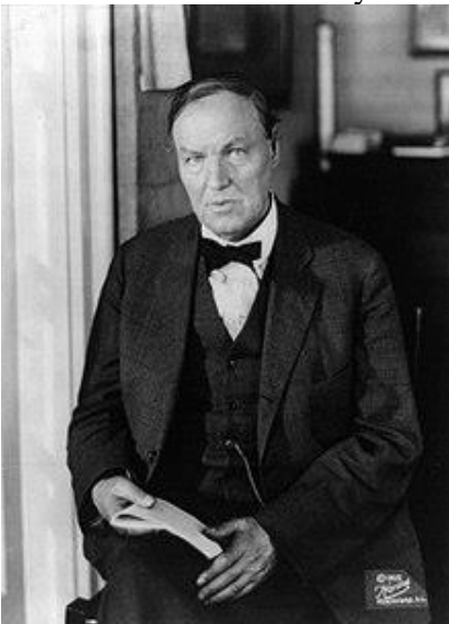
Clarence Seward Darrow (1857-1938)

Tässä onnistuttiinkin yli odotusten, kun syyttäjän avustajaksi saatiin kuuluisa kansanmies, evoluutio-opetusta vastustavan lainsäädännön isä William Jennings Bryan . Puolustuksen asianajajaksi puolestaan ilmoittautui vapaaehtoisena eräs USA:n parhaista asianajajista, Clarence Darrow , jonka mielestä evoluution ja luomisen välinen väittely oli jälleen uusi esimerkki uskonnon ja tieteen ikuisesta sodasta. Darrow oli vakaumukseltaan agnostikko, Bryan fundamentalisti. Daytonin kaupunki täyttyi toimittajista. Turisteja tuli odotettua vähemmän, sillä sanomalehtien ja radion avulla oikeudenkäynnin kulkua pystyttiin muutenkin seuraamaan ympäri USA:ta.