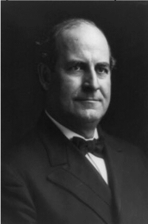
William Jennings Bryan Yhdysvaltain ulkoministerinä vuosina 1913-1915

Evoluutio-opetusta rajoittava ”Butlerin asetus” kielsi evoluution opettamisen Tennesseeen julkisesti rahoitetuissa kouluissa. Asetuksessa kiellettiin ”minkä tahansa sellaisen teorian opettaminen, joka kieltää Raamatun opettaman kertomuksen jumalallisesta luomisesta, opettaen sen sijaan, että ihmiset ovat kehittyneet alemmista eläimistä.”