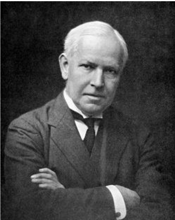
Grafton Elliot Smith (1871-1937)

Käsin kosketeltavan todistuskappaleen olemassaolo sai monet epäröimään uskoaan luomiseen ja aiheutti valtavan reaktion kristillisessä maailmassa.