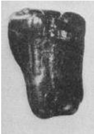
”Nebraskan ihmisen” hammas

Puolustusasianajajat ja heidän kannattajansa käyttivät oikeudenkäynnin jälkeisessä mediarummutuksessa tärkeänä todisteena hammasta, joka oli löytynyt Nebraskasta. Kehitysoppia kannattavat tiedemiehet pitivät sitä apinaihmissen hampaana ja siis puuttuvana lenkkinä, joka todisti, että ihminen on kehittynyt apinasta. Raamatulliset uskovat olivat heidän mielestään taantumuksellisia, koska he vastustivat tiedettä ja kehitystä. Siksi heidät tehtiin naurunalaisiksi.