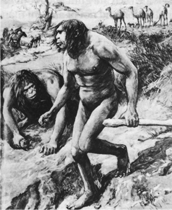
Nebraskan ”apinaihminen” Hesperopithecus haroldcookii . Kuva on julkaistu Illustrated London News -lehden sivuilla vuonna 1922.

Alkuihmisen tarina lähetettiin kauniisti kuvitettuna kautta maailman lukijoiden ihmeteltäväksi. Luomisoppia kannattava syyttäjä ja hänen kannallaan olevat opetusviranomaiset saatiin näyttämään vanhoillisilta tieteellisen ajattelutavan vastustajilta.