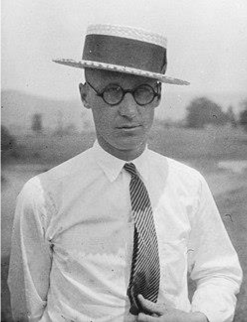
John Scopes kuukautta ennen oikeudenkäynnin alkua kesäkuussa 1925

kansalaisoikeusliitto ACLU oli palkannut hänet tähän tehtävään tarkoituksenaan selvittää, rikkoiko tämä kielto maan perustuslakia.