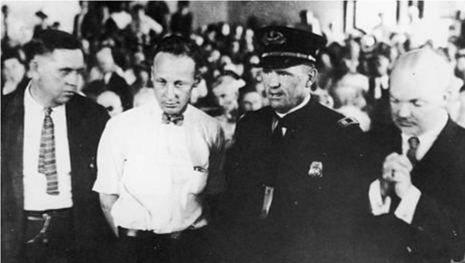
Evoluution opettamisesta syytetty John Scopes toinen vasemmalta oikeussalissa Daytonissa, Tennesseessä kesällä 1925

Puolustus hiillosti ja pilkkasi oikeudenkäynnin aikana William Bryania, niin että hän kuoli sydänhalvaukseen viisi päivää oikeudenkäynnin jälkeen 65-vuotiaana.