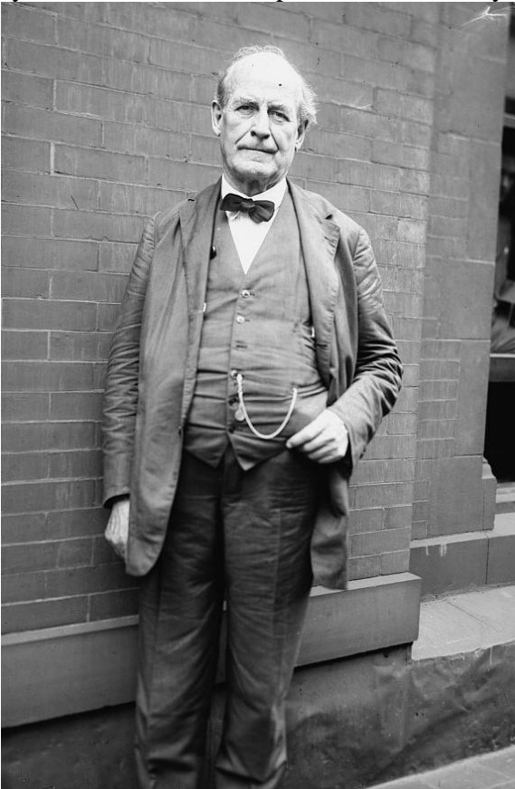
William Jennings Bryan (1860-1925)

Puolustus hiillosti ja pilkkasi oikeudenkäynnin aikana William Bryania, niin että hän kuoli sydänhalvaukseen viisi päivää oikeudenkäynnin jälkeen 65-vuotiaana.